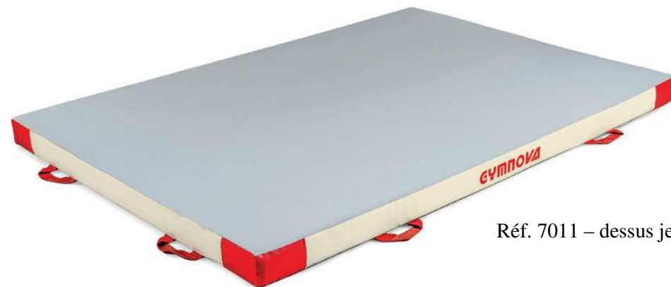
Réf. 7011 – dessus jersey