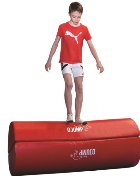
Réf. 066 x 2