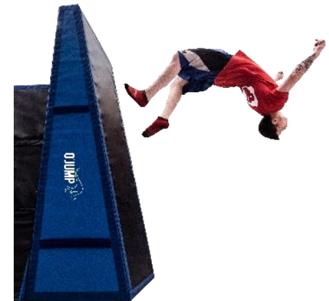
Réf. 910 (911+912)