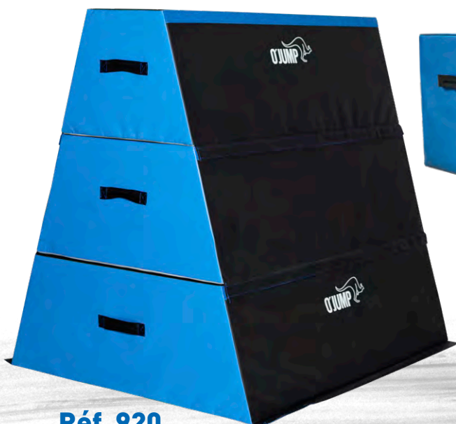
Réf. 920 TRAPÉZIUM