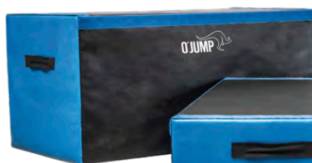
Réf. 930 BLOCKS