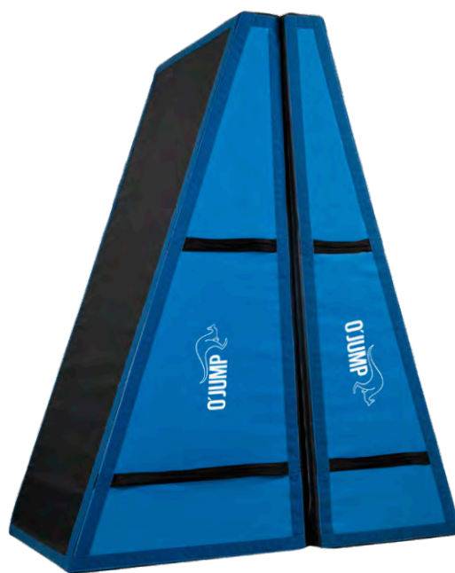
Réf. 910 PLANS INCLINÉS