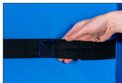
Poignées ou sangles de portage

FORCE ÉQUILIBRE CONFIANCE EN SOI SANTÉ BIEN-ÊTRE CRÉATIVITÉ TRAVAIL EN ÉQUIPE