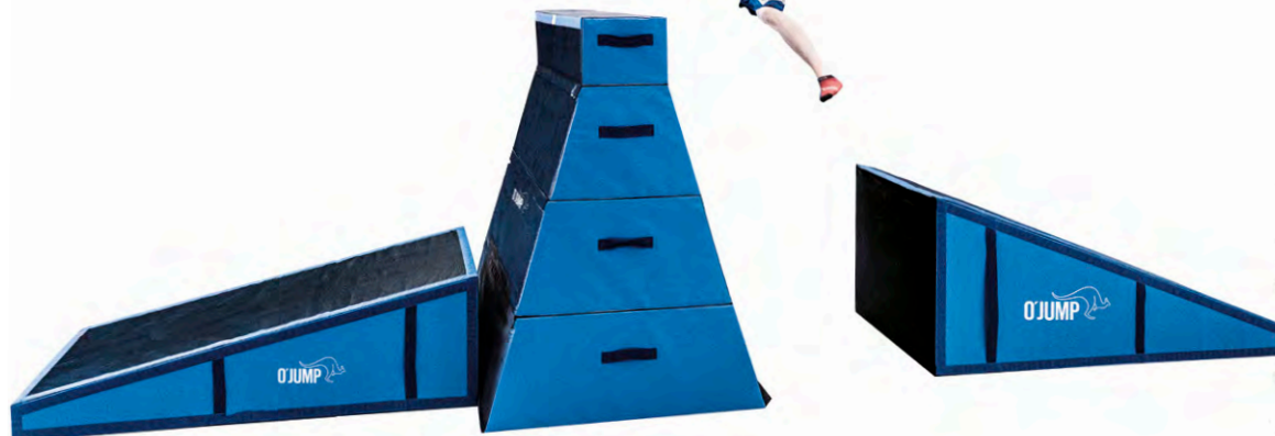
Réf. 920 & 925