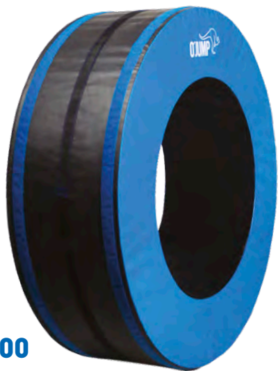
Réf. 900 TRICKING HOOP

Regroupe tous les modules nécessaires pour la pratique de la gymnastique urbaine. Le kit est composé des références ci-dessous :