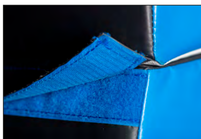
Solidarisation des éléments par bandes auto-agrippantes